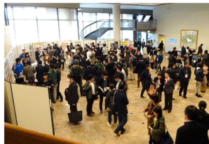
(ポスターセッション)