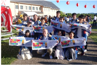
[ 湖風夏祭でのSDGs宣言 ]

学長と学生が「滋賀県立大学SDGs宣言」を実施したほか、県大SDGsアンバサダー事業として、SDGsの先進的な活動を行う大学に学生を派遣し、学生団体等の取材や意見交換を行うなど、交流を図った。