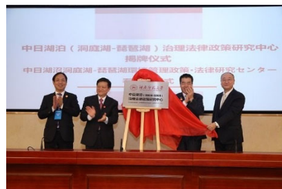
[ 中日湖沼洞庭湖－琵琶湖環境管理政策・法律研究センター除幕式 ]

また、アジア圏の研究機関と連携して、湖沼流域管理に関する政策・社会科学分野における共同研究等を推進するため、環境科学部の附属施設として「湖沼流域管理研究センター」を平成30年11月に設置した。このセンターでは、中国湖南省に設立された「中日湖沼洞庭湖－琵琶湖環境管理政策・法律研究センター」との間で、研究者や学生の相互交流を図りながら共同研究や人材育成を進めることとし、中国湖南省で11月13日に行われた除幕式に、理事長および環境科学部長（湖沼流域管理研究センター長）が滋賀県知事とともに出席したほか、「研究コミュニティ形成促進費」を活用して、関係機関等と連携した研究会を実施するなど、研究コミュニティの形成を進めた。