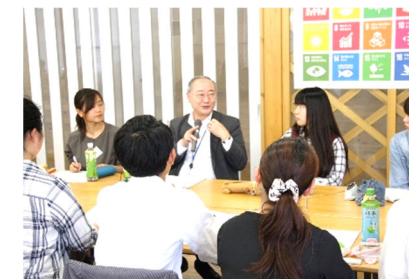
[ 学長と学生との意見交換 ]

SDGsにかかる取組の実施にあたり、学生の視点からの意見や提案などを聴き、事業に反映させるため、学長と学生を交えた意見交換を行い、平成30年6月16日の「湖風夏祭」において、