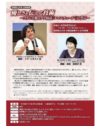
[ 公開講演チラシ ]