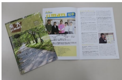
[ 「県大 jiman」第 24 号 ]

学生スタッフが主体となって企画・編集等を行っている大学広報誌「県大 jiman」では、平成 31 年 2 月に発行した第 24 号において、三日月大造滋賀県知事へのインタビューを行い、SDG s の取組や学生生活に対する考えなどについて、対談形式の特集を掲載した。この特集では、本学の「近江楽座」などの活動にも触れつつ、SDG s の理念や取組などについて、学生等に向けて発信した。