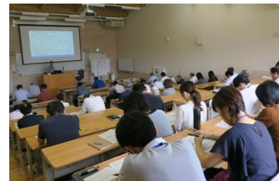
[ FD・SD 研修会 ]

FD・SD 研修会として、「SDGs と大学キャンパス」をテーマに、大学における SDGs 関連の取組の実例や可能性に関する研修を実施したほか、戦略的な広報に取り組みされている近畿大学から講師を招いた「知と汗と涙の近大流コミュニケーション戦略」をテーマとした広報マインド向上研修、留学生交流推進会議での「大学におけるグローバル人材育成とは」をテーマとした講演、PROG デストの分析結果を解説する研修など、多様な研修機会を設けた。