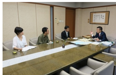
[ 知事インタビューの様子 ]

また、全学的な広報推進体制を強化するため、教職員を対象とした広報マインド向上研修を 12 月に実施したほか、広報連絡員会議の開催、学内向けの広報ニュースレターの配信などにより、広報マインドの向上を図るとともに、広報連絡員等が連携して広報素材の掘り起こしに努め、新たに大学講座情報を新聞社に提供するなど、