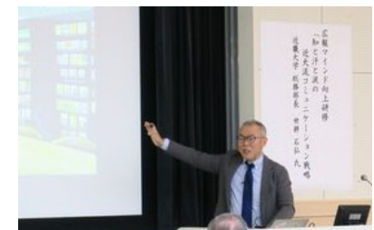
[ 広報マインド向上研修 ]

また、事務局の職員構成として、法人職員の人数が県派遣職員を上回るようになる中で、法人職員の資質向上・能力開発を総合的に推進できるよう、法人職員人材育成方針の見直しを行った。見直しにあたっては、事務局法人職員を対象に人材育成・研修制度等に関するアンケート調査を実施し、この結果等を踏まえて、平成 31 年 3 月に法人職員人材育成方針を改定した。新たな人材育成方針では、キャリアパスと研修を組み合わせ、計画的なジョブローテーションと多様な研修制度の整備を図ることとしたほか、求められる職員像や職階ごとの能力、キャリアパスモデルのイメージなどを具体的に示した。