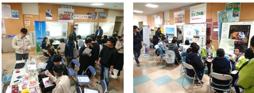
[ ジョブ交座 ]

COC+事業により、キャリア教育の充実に取り組んできたが、「地域中小企業講座」における企業経営者等による講義や、課題解決等の内容を含む15日間の就業体験を行う中期インターンシップなどの取組を継続して実施するとともに、新たな取組として「ジョブ交座」を実施した。これは、ランチタイム時に学生が集まる学生ホールにおいて、本学のOB・OGを含む地元企業の若手社員と気軽に意見交換できる場を設けるもので、平成30年度は試行として3回開催した。この取組により、学生の県内企業に対する理解の促進を図るだけでなく、学年に関係なく早くから様々な業種の社員と接することで、学生のキャリア選択の幅を広げることにもつながっている。