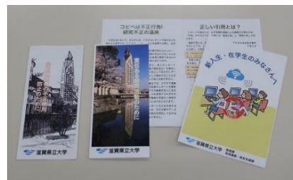
[ 研究倫理教育リーフレット ]

さらに、研究活動上の不正行為防止計画に基づく取組の一つとして、学生への研究倫理教育および情報倫理教育のためのリーフレットを作成し、新入生に配付することとした。