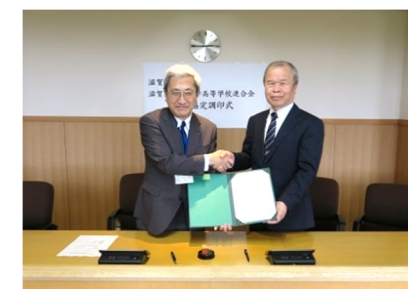
[ 滋賀県私立中学高等学校連合会との連携協定締結式 ]

また、高大連携事業の充実に向け、平成30年5月に滋賀県私立中学高等学校連合会と連携協定を締結した。これを受け、これまで県の教育委員会との共催により実施してきた大学連携講座を、県内の私立高等学校を加えた形で実施し、新たに40名の生徒の参加を得た。