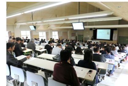
[ コンプライアンス研修 ]

コンプライアンス研修として、SNS 利用によるリスクをテーマに、SNS に関する基本的な知識をはじめ、炎上事例やトラブル防止の対策などについて、実例を交えた研修を実施した。効果的な研修とするため、管理監督者向けと一般教職員向けの 2 回に分け、求められる役割や習得すべき知識等に応じた研修内容にするとともに、研修参加率 100% を目指して、一般教職員向けは全学休講日の開催として積極的な参加を呼び掛けたほか、事務局においては、欠席者に対する伝達研修を行った。