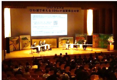
(パネルディスカッション)

平成31年3月16日には「びわ湖で考えるSDGs」と題したSDGs学生大会を開催し、知事による基調講演、知事・大津市長を交えたパネルディスカッションのほか、学生団体等の活動を紹介するポスターセッション、学生活動が抱える課題の解決策や新たな展開等をディスカッション形式で話し合うワークショップなどを実施した。県外を含む17大学、10高校、1中学校、1小学校をはじめとして、学生を中心に359名の参加があり、活発な意見交換と交流が行われた。