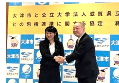
[ 大津市との包括連携協定締結式 ]

地元経済界や自治体等との連携・協力を進め、彦根市をはじめとする県内自治体とも連携協定を締結してきたが、平成31年1月に、自治体としては12団体目となる大津市と包括連携協定を締結した。この協定では、SDGsの普及、環境保全や県内雇用の推進、人材育成、地域活性化、文化振興、学校教育・生涯学習等を連携事項とし、協定締結式に併せて大津市長と学長による意見交換を実施したほか、3月16日に開催したSDGs学生大会のパネルディスカッションに大津市長が登壇するなど、具体的な取組を進めた。