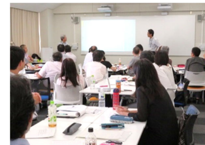
[ アクティブラーニング研修 ]

教育環境の整備としては、多様な授業形態に対応できるよう、平成29年度に改修した1室に加え、新たに講義室1室をアクティブラーニング対応仕様に改修し、電子黒板、複数のホワイトボード等を設置した。平成30年度後期授業から供用を開始し、併せて「学生を授業に参加させる秘訣」をテーマとしたアクティブラーニング研修を実施したことなどにより、ディベートやグループワークなどの授業形式がさらに浸透し、改修した講義室の稼働率も向上した。この研修は、FD活動の一環として、関西地区FD連絡協議会との共催により実施したが、他大学の教員からも好評で、本学における授業改善活動のレベルの高さを確認する機会となった。