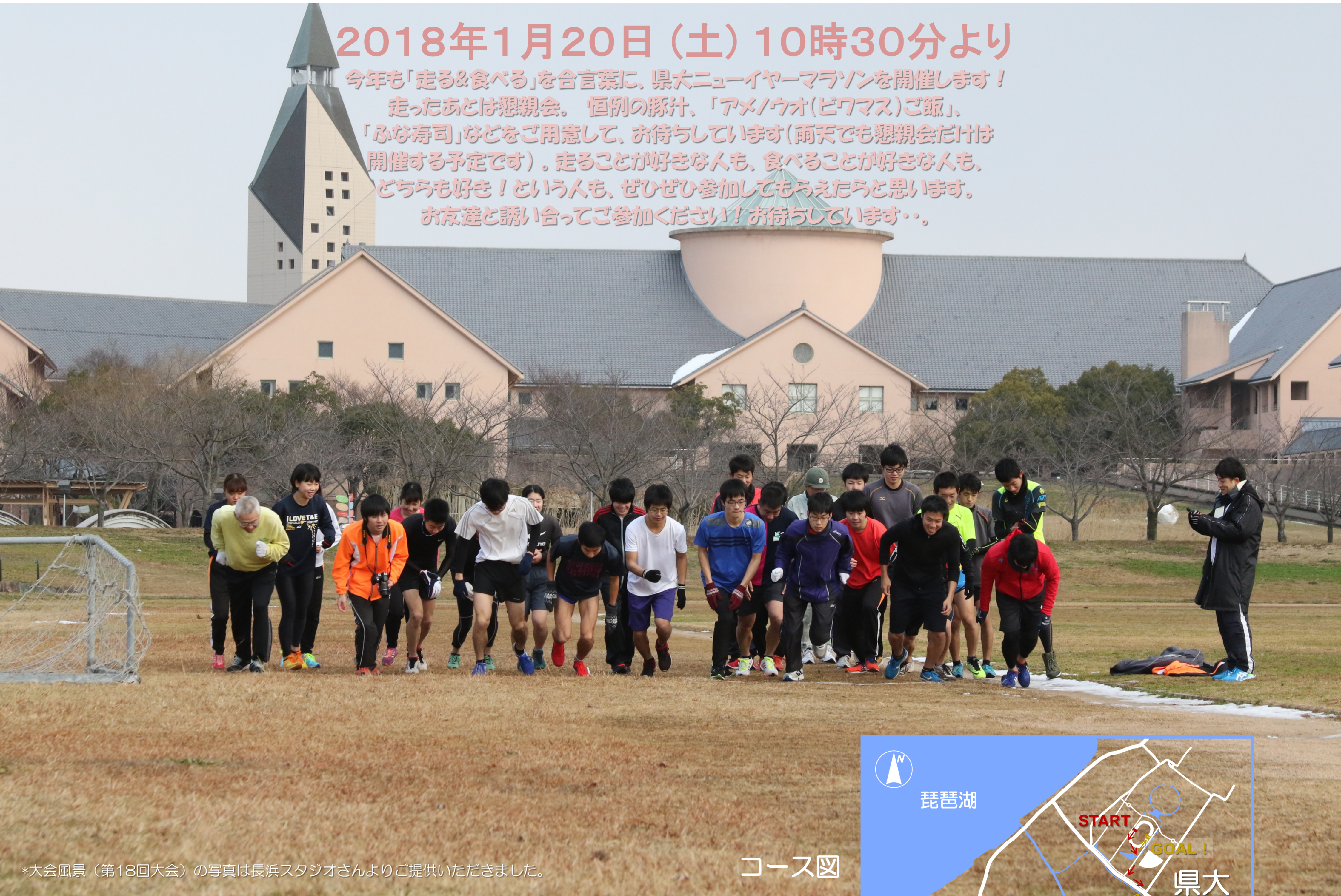
*大会風景(第18回大会)の写真は長浜スタジオさんよりご提供いただきました。

今年も「走る&食べる」を合言葉に、県大ニューイヤーマラソンを開催します！ 走ったあとは懇親会。恒例の豚汁、「アメ/ウオ(ピワマス)ご飯」、 「ふな寿司」などをご用意して、お待ちしております(雨天でも懇親会だけは 開催する予定です)。走ることが好きな人も、食べることが好きな人も、 どちらも好き！という人も、ぜひぜひ参加してもらえたらと思います。 お友達と誘い合ってください！お待ちしております。。