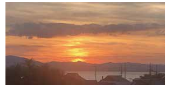
▲環境科学部棟から見える景色

環境科学部棟の3階に僕の部屋があるのですが、その琵琶湖側にある非常階段からの景色を見ることが、僕の「ひとやすみ」です。時間によっても見える景色が変わるのですが、特に夕方の景色は夕日と琵琶湖が合わさってとても美しい景色です。