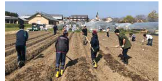
▲滋賀県立大学の農場

良いところのひとつは琵琶湖に近いということです。琵琶湖が研究のフィールドワークにもなっている大学はここだけです。また、これは環境科学部生にむけてになりますが、講義をする場所と農場がものすごく近いところも良いところの1つです。他の大学であれば、講義をしているキャンパスから農場がとても遠くてなかなかたいへんですが、この大学だと、座学をしつつ、その流れで農場へということが出来ます。普通の大学ではなかなか味わえないスタイルの勉強ができることがうちの良いところですよ。