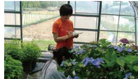
▲アジサイを研究する学生の姿

花の美しさを引き出すことを研究しているので、学生には毎日植物に触れてもらうようにしています。そして、1つでも多くなにかを発見してもらい、植物を感じてもらおうようにしています。その中で学生が得た知識や発想が間違ってもそれを否定せずに、僕の知識などをアドバイスします。一方で、学生の意見は僕が思いつかなかった着眼点を持っていることもあり、一緒に研究をするような感覚でいます。