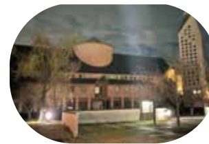
▲気づいたら夜になっていた図書館