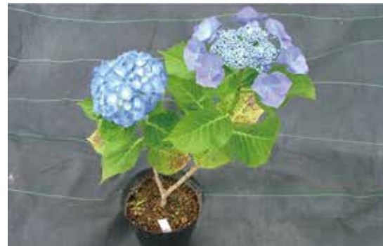
▲変異型のアジサイ（左）と野生型のアジサイ（右）

野生のアジサイの花はたくさんの小花の集合体で、虫を呼ぶ派手な少数の小花と種を作るたくさんの地味な小花で構成されています。私たちが普段目にするボール状のアジサイの花は虫を呼ぶ小花のみの集合体で突然変異によるものです。突然変異でできたアジサイの花は野生の状態では生き残ることが出来ません。人間が野生群落で見つけたこの突然変異個体を大切に維持し、育種に利用してきました。アジサイの虫を呼ぶ小花は桜の花びらと違って散りません。この花びらは普通の花の萼が変化したものであるため、散らずに虫を招き続けます。このような散らない花びらの性質をもつ花は他にもあり、食堂の横の花壇にある千日紅がそれに当たります。アジサイや千日紅といった花がなぜ散らない花の特性をもっているのかという研究を主にしています。