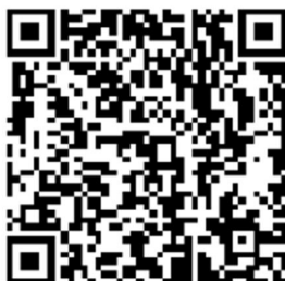
新入生特設サイト QR コード

【新入生特設サイト】 https://www.linc.usp.ac.jp/info_center/info_new%20student.html